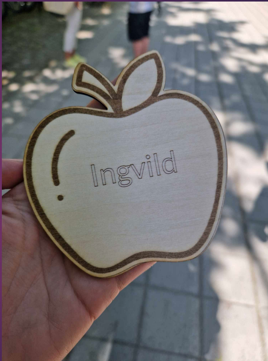
Gulleple laga av Øyvind Opheim Rise